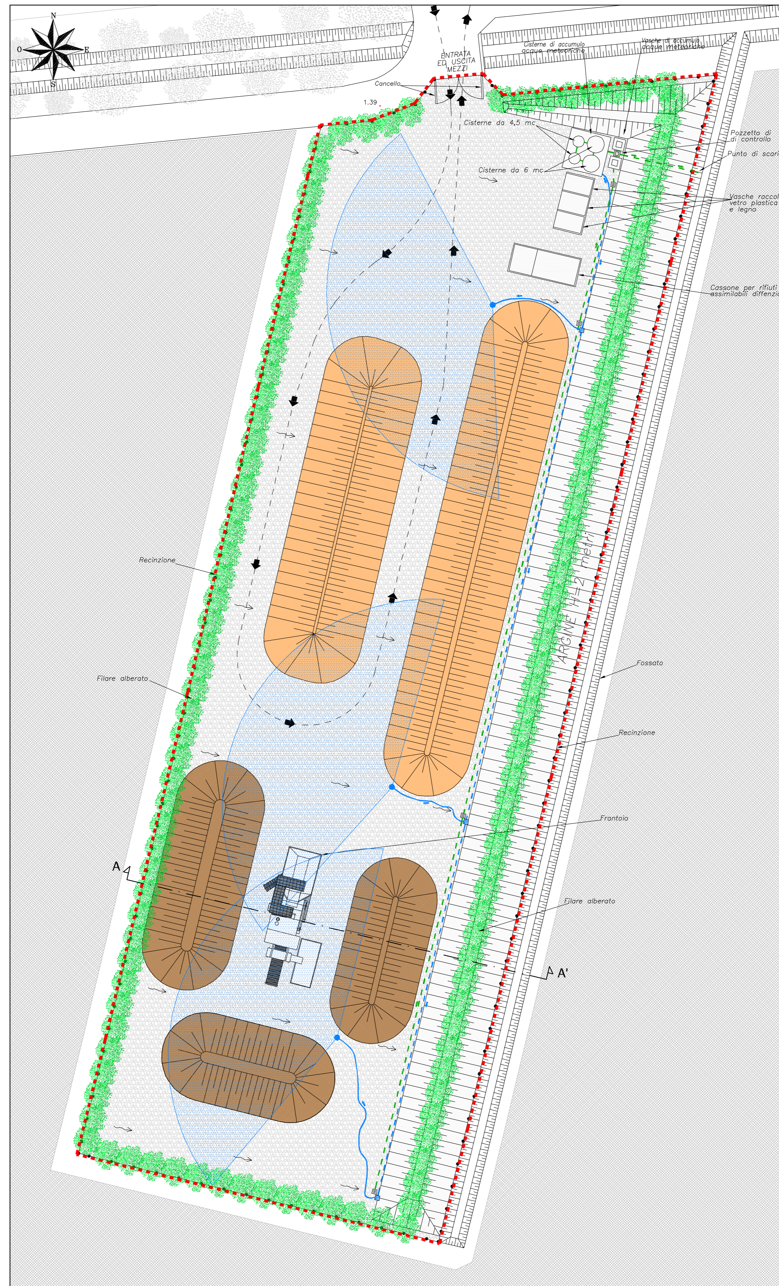
PLANIMETRIA IMPIANTO Scala 1:200