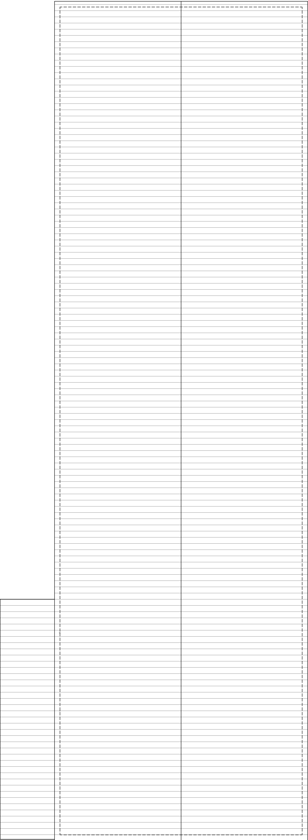
PIANTA COPERTURA Scala 1 : 100