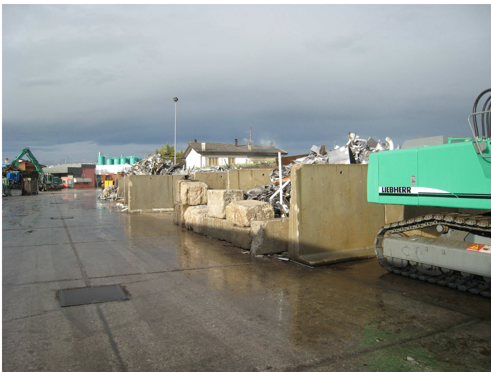
Foto 5 – zona deposito Materie Commerciali derivanti da recupero metalli non ferrosi.