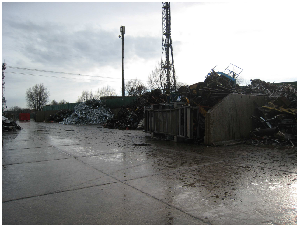
Foto 4 – zona deposito Materie Commerciali derivanti da recupero metalli ferrosi.