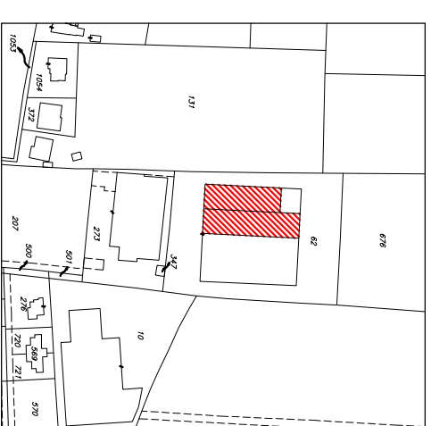
ESTRATTO MAPPA CATASTALE scd10 1:2000