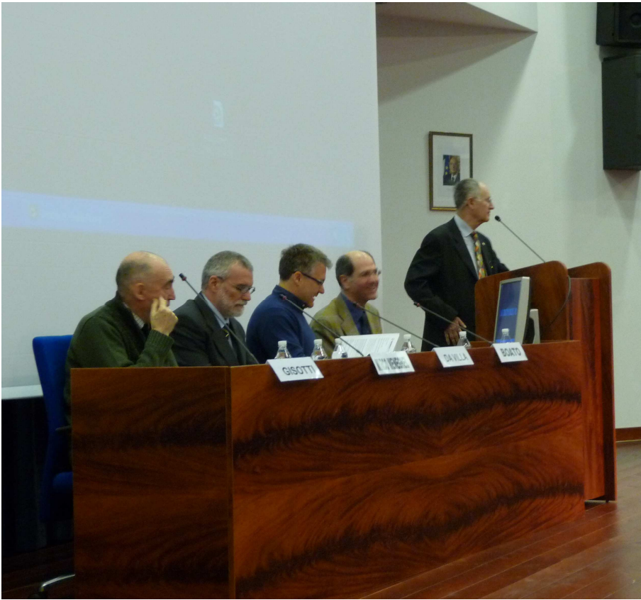
Tavolo delle Autorità