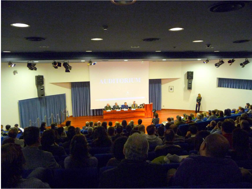
Auditorio ed Autorità