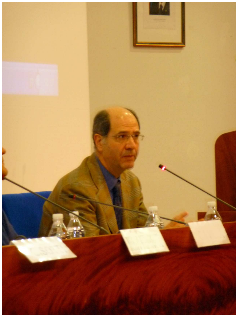
S. Boato, D.T. ARPAV