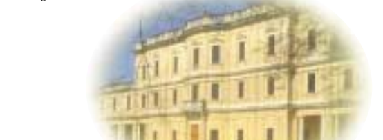
villa Farsetti a S. Maria di Sala

Tra i piccoli mammiferi, la confidente Arvicola ( Arvicola terrestris ) si può osservare nelle rive ricche di vegetazione mentre la più elusiva Lepre ( Lepus euro paeus ) preferisce le ore crepuscolari per uscire ad alimentarsi nelle campagne circostanti. L'avifauna è abbondante durante tutto l'arco dell'anno e comprende numerose specie di passeriformi canori: la Cannaiola verdognola ( Acrocephalus palustris ) e l' Usgnolno di fiume ( Cettia cetti ) frequentano i cespuglietti del bosco ripario, il Picchio rosso ( Picoides major ) e il Rigoglio ( Oriolus oriolus ) preferiscono i pioppeti maturi, mentre il Martin pescatore ( Alcedo atthis ) nidifica negli argini fluviali meno disturbati. Piuttosto comune è la Gallinella d'acqua ( Gallinula chloropus ), specie diffusa e facilmente adattabile che si rinviene anche presso specchi d'acqua ristretti. Abbisogna della presenza di una certa copertura vegetale per poter nidificare e sembra poco disturbata dalla presenza dell'uomo. Infine, la presenza invernale degli aironi testimonia il collegamento ecosistemico con la vicina Laguna di Venezia. La Garzetta ( Egretta garzetta ) e l' Airone cenereo ( Ardea cinerea ), infatti, si spostano tradizionalmente nelle campagne del Miranese per trovare nutrimento, seguendo appunto il corso dei fiumi di risorgiva.