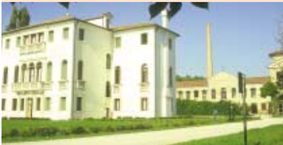
villa Donà e filanda (sullo sfondo) a Salzano

Da questa località lasciamo quindi le arginate che delimitano il lento corso del fiume Muson ed introduciamoci per la campagna circostante dirigendoci verso Sud, lungo un rettilineo, anzi un 'cardo'. Siamo, infatti, in pieno 'graticolato romano': tutto il territorio a Nord-Est di Padova delimitato, appunto, dal Muson, ha per caratteristica più evidente l'organizzazione a maglie quadrate, di 714 metri di lato, risalente a circa duemila anni fa. Tale ripartizione, di mirabile ingegno, venne creata a partire dal tracciamento sul terreno di due assi ortogonali: il Cardo Massimo (in senso Nord-Sud) ed il D e c u m a n o