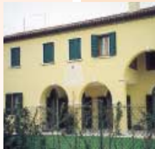
casa rurale di Mirano