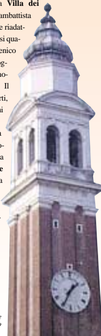
campanile di Mirano