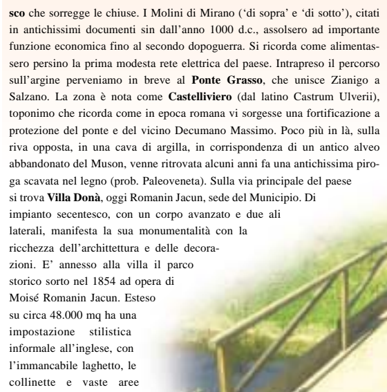
ponte degli Armati